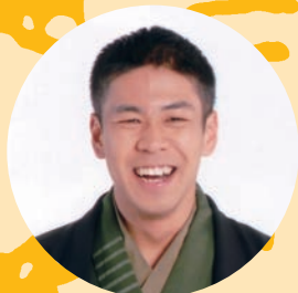
桂米紫 「イモリの黒焼き」